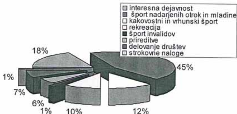
Tabela 3 Delež sredstev po vsebini za leto 2015

Največji delež sredstev tudi v letu 2015 je namenjen športu otrok in mladine, skupno 63%, športu starejših je skupno namenjeno 23% sredstev, 6% za prireditve, 7% je namenjeno strokovnemu delu in delovanju društev in zvez, kar je manj kot v preteklih letih in 1 % strokovnim nalogam (usposabljanja).